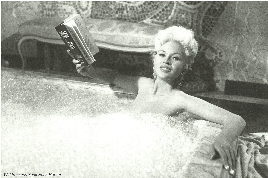
Will Success Spoil Rock Hunter

Andere deelprogramma's betroffen onder andere een serie Duitse muzikale komedies uit de jaren dertig, met onder meer de vermakelijke originele versie van Viktor und Viktoria en Ludwig Bergers Ich bei Tag und Du bei Nacht . Verder