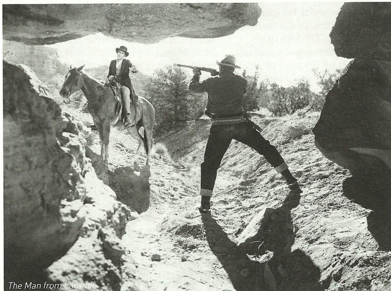
The Man from Laramie