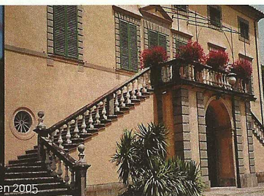
Villa La Badiola (Toscane) in 1976 en 2005

Als je vandaag de dag als toerist rondloopt in de Romeinse Galleria Colonna, herinnert niets eraan dat dit voornamelijk en kolossale stadspaleis dertig jaar geleden de filmset was voor Luchino Visconti's laatste film, L'innocente (1976). Behalve in het Palazzo Colonna, waar hij aan het begin van zijn film twee kamerconcerten situeerde, filmde hij in twee villa's in Toscane, maar zijn belangrijkste set was de negentiende-eeuwse Villa Mirafiori. Deze Romeinse villa werd in 1874 gebouwd voor 'la bella Rosina', de morganatische echtgenote van koning Victor Emmanuel II. Precies honderd jaar later functioneerde het als de woning van Tullio Hermil, de hoofdpersoon van L'innocente .