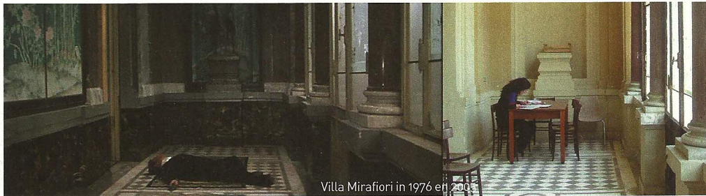
Villa Mirafiori in 1976 en 2005