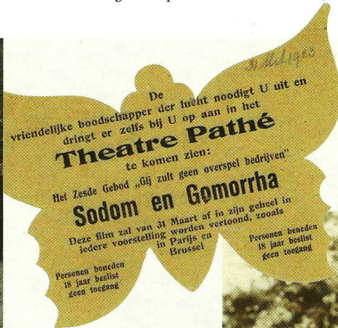
Reclamebiljet uit 1923 voor de pikante bijbelfilm Sodom en Gomorrha van Mihael Kertesz alias Michael Curtiz: "Personen beneden 18 jaar beslist geen toegang."