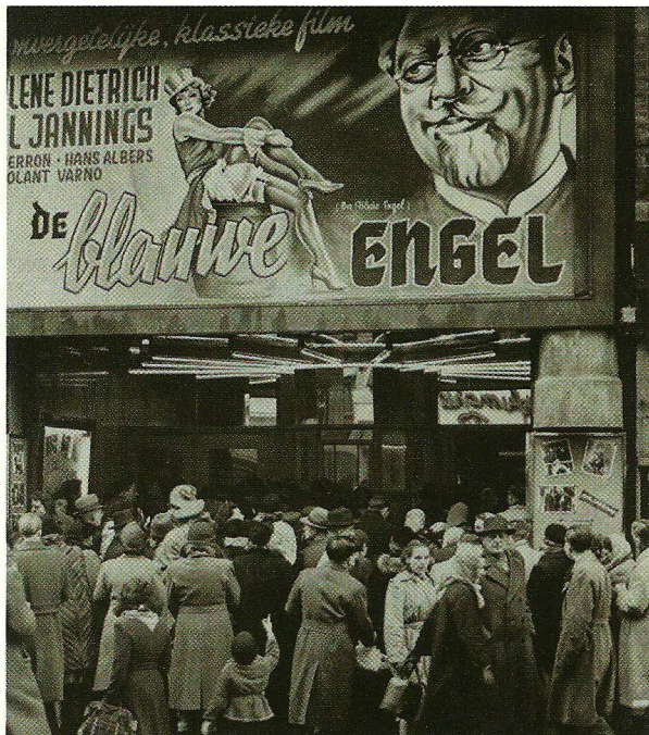
Na de sluiting van Theater Pathé en een ingrijpende verbouwing van Kalverstraat 122 ging hier in 1925 bioscoop Corso open. Die bestond tot 1979. In 1930 draaide hier De Blauwe Engel, met in de hoofdrol Marlene Dietrich. Hierin zong zij haar beroemde lied "Ich bin von Kopf bis Fuss auf Liebe eingestellt."

echter raakte de behoefte aan oorlogsbeelden oververzadigd. In 1916 veranderde de programmering van de Pathé-bioscoop dan ook ingrijpend. Vanaf 10 november was wekelijks de Amerikaanse Pathé-seriefilm De Avonturen van Elaine ( The Perils of Pauline ) met Pearl White te zien en was een groot succes. Vanaf dat moment waren de Amerikaanse misdaadserials een vast onderdeel in de programmering en bepaalde jarenlang het imago van de bioscoop. Serial queens als Pearl White, Ruth Roland, Grace Cunard en Marie Walcamp waren bij het publiek populair, maar de filmrecensenten haalden er hun neus voor op. Het Algemeen Handelsblad schreef op 9 september 1917: "Nu de wereldoorlog bij ons in het stadium is gekomen van broodkaarten en kolen nood, hebben de oorlogsfilms veel van hun actualiteit verloren. De dagen, dat in het Theater Pathé een enthousiast publiek keek naar de zegevierende Fransche troepen van Verdun en luisterde naar de tonen van den prachtige marsch "Sambre et Meuse", zijn al lang geleden. Als thans het Hollandsche publiek over den oorlog praat, praat het meestal over den vrede, die nog altijd niet komen wil." Toch ging drie weken later de propagandafilm Mères françaises ( Franse moeders ) met theatervedette Sarah Bern-