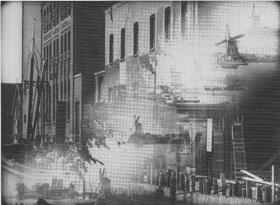
Foto uit 'De Zaanstreek'. (Duyvis, uit 7 molens ontstaan.) Foto Nederlands Filmmuseum.

Men moet niet vergeten dat de avantgardistische documentaires van cineasten als Joris Ivens nog gemaakt moesten