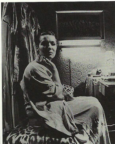
'It's me' van Frans Zwartjes

Het Fotomuseum Den Haag organiseert op 21 mei, 4 juni en 18 juni filmavonden rond het werk van Frans Zwartjes (1927). Ook tijdens de Filmmuseum Biënnale (23 t/m 27 april) is er een selectie uit het werk van de experimentele filmer en kunstenaar door gastcurator Gertjan Zuilhof te zien. Het oeuvre van Zwartjes werd recentelijk door het Filmmuseum gerestaureerd en geconserveerd. Zie voor aanvangstijden en programma-overzicht Fotomuseum Den Haag: www.gem-online.nl .